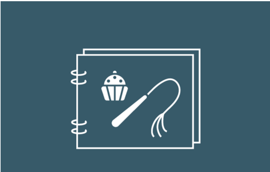
Как быть строгим боссом и не перегнуть палку